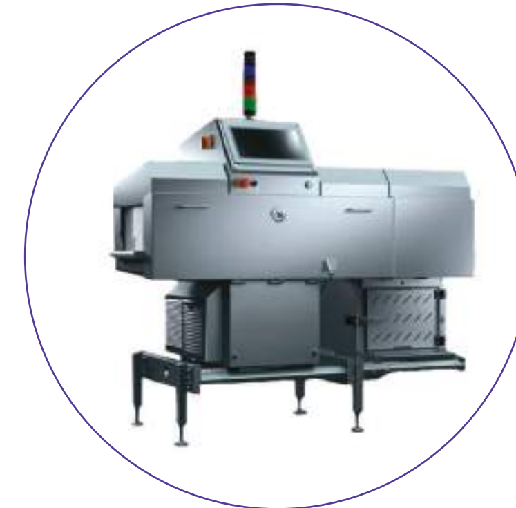
SISTEMAS DE CONTROLO RAIO-X PESO METAIS CORPOS ESTRANHOS