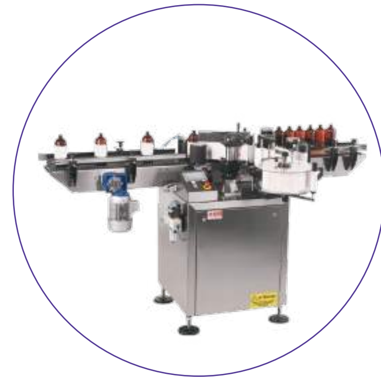
ETIQUETAGEM & MARCAÇÃO