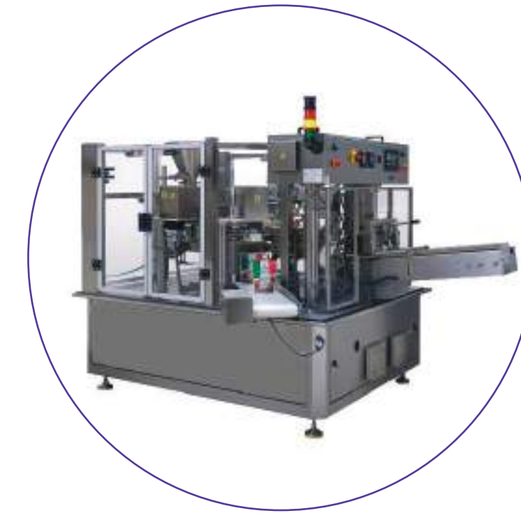
DOSAGEM, ENCHIMENTO & SELAGEM DOYPACK