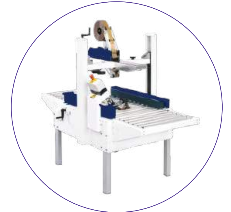
SISTEMAS FIM DE LINHA