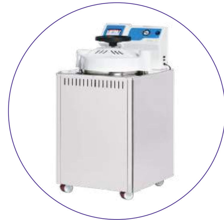
SISTEMA DE PASTEURIZAÇÃO