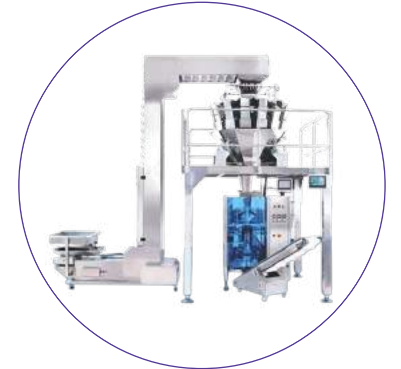
DOSAGEM, ENCHIMENTO & SELAGEM PILLOW BAG BLOCK BOTTOM GUSSETED STABILO